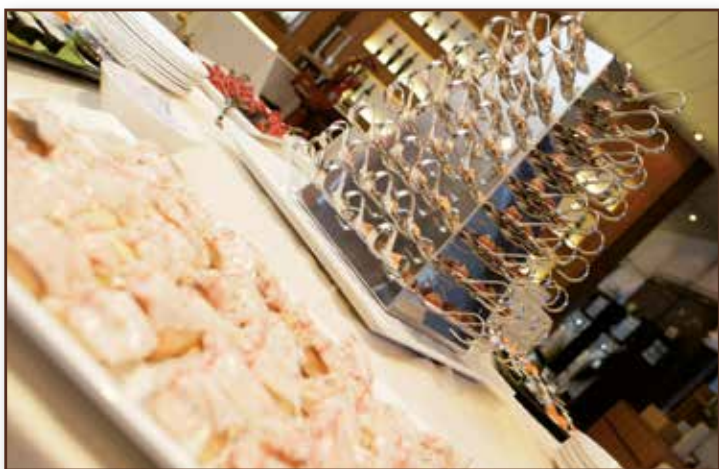
Servizio catering dinner