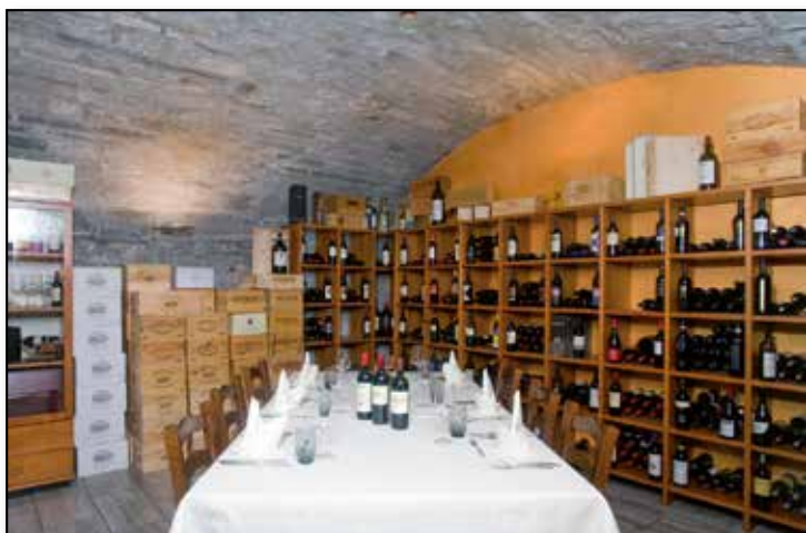
Enoteca • Sala per eventi